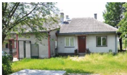
Opracował: Wacław Kania

Tak więc azbestu mamy w gminie coraz mniej, ale nadal jeszcze pozostaje wiele do zrobienia.