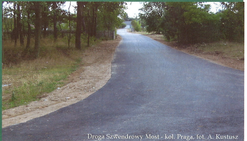
Droga Szwendrowy Most - kol. Praga

- ułożono dywanik asfaltowy na drodze gminnej Szwendrowy Most – kol. Praga na odcinku 995 m. Koszt 133,2 tys. zł.