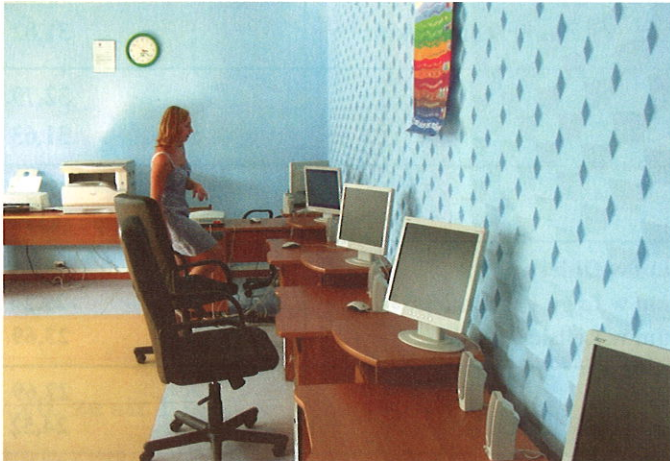
Centrum Informacji tuż przed inauguracją

Bliższe informacje tel. 029/ 7611077. e-mail gok-o@o2.pl