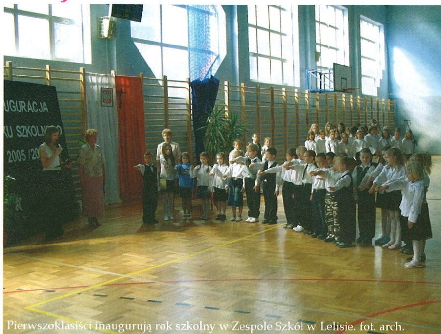
Pierwszoklasiści inaugurują rok szkolny w Zespole Szkół w Lelisie.

W okresie wakacji wykonano na rzecz szkół wiele prac remontowych. Zakończono zagospodarowywanie otoczenia szkoły Podstawowej w Łęgu Starościńskim. W Szkole Podstawowej w Białobielu odnowiono trzy sale lekcyjne i wymieniono w nich posadzki. W Szkole Filialnej w Durlasach odnowiono wszystkie pomieszczenia oraz pomalowano ogrodzenie szkolnej posesji. W Szkole Podstawowej w Olszewce odnowiono część pomieszczeń oraz naprawiono dach. Dzięki tym pracom wszystkie szkoły w gminie zostały dobrze przygotowane do rozpoczęcia roku szkolnego.