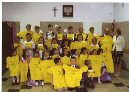
Na zdjęciach: rywalizacja Asów w Szkole Podstawowej w Nasiadkach