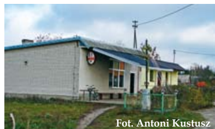
Fot. Antoni Kustusz

Źródło: Projekt Planu Odnowy Wsi Łęgu Starościńskiego.