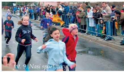
fot. 9. Nasi sportowcy

W klasyfikacji gminy w roku szkolnym 2008/2009 Szkoła Podstawowa uplasowała się na drugim miejscu.