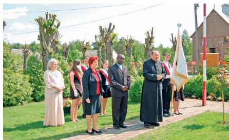
foto 2. Złożenie kwiatów przy kamieniu pamiątkowym w Dniu Patrona Szkoły

W naszej szkole kultywowane są tradycje regionalne, wartości patriotyczne i wydarzenia historyczne poprzez organizowanie apeli, akademii i eksponowanie na gazetkach szkolnych. Jedną z najważniejszych uroczystości w naszej szkole jest Święto Szkoły czyli Dzień Patrona Kardynała Stefana Wyszyńskiego. W tym dniu nie ma zajęć lekcyjnych. Uczniowie, nauczyciele i pracownicy szkoły uczestniczą we mszy świętej, składają kwiaty przy kamieniu pamiątkowym oraz biorą udział w uroczystej akademii.