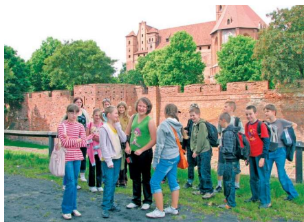
foto 5. Wycieczka do Malborka

Podróże kształcą... W trakcie minionego roku szkolnego uczniowie wielokrotnie wyjeżdżali w różne rejony kraju w celu pogłębiania i rozszerzania wiedzy zdobywanej na zajęciach dydaktycznych. Odwiedziliśmy Tatrzański Park Narodowy, Klasztor o.o. Paulinów w Częstochowie, Malbork, Warszawę, Mikołajki, Biebrzański Park Narodowy, Muzeum Przyrodnicze Drozdowo, Łomżę, Zambrów, Kraków Park dinozaurów w Kołacinku. Dzieci i młodzież organizowali wspólnie z nauczycielami i rodzicami kuligi, wyjazdy na biwaki, wyjazdy do kina i teatru, ogniska, dyskoteki.