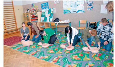
fot. 11. Warsztaty z udzielania pierwszej pomocy

Tegoroczny Dzień Dziecka był wyjątkowy i przebiegał w „militarnej” atmosferze. Dzieci mogły zobaczyć zabytkowe pojazdy z 1942 roku, żołnierzy w mundurach z okresu II Wojny Światowej, broń strzelecką, wystawę fotograficzną oraz skosztować grochówki z kuchni polowej. Chętni mogli sprawdzić swoje umiejętności strzeleckie.