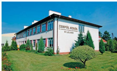
foto 1. Budynek szkoły