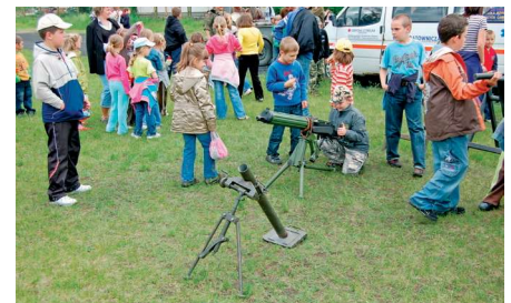
fot. 12. Dzień dziecka

Bierzemy również udział w akcjach: „Sprzątanie Świata”, „Góra grosza”, „Zbiórka zużytych baterii”.