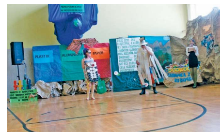
foto 6. Gminny turniej ekologiczny