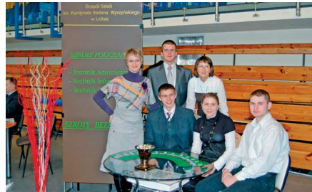
fot. 10. Prezentacje edukacyjne

Nasza szkoła co roku uczestniczy w prezentacjach edukacyjnych, na których promujemy naszą ofertę edukacyjną, a młodzież może zapoznać się z propozycjami innych szkół.