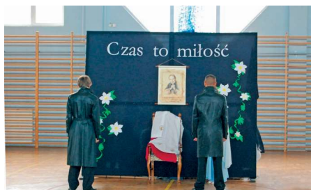
foto 3. Na uroczystej akademii