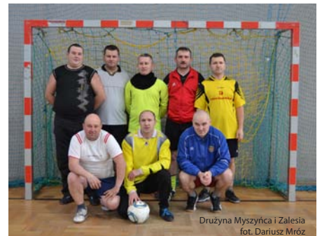
Drużyna Myszynca i Zalesia