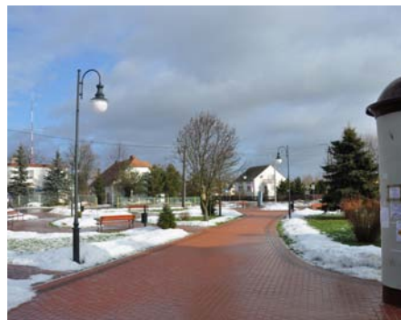
Stara Łomża. Termin wykonania do 14 czerwca 2013 r.