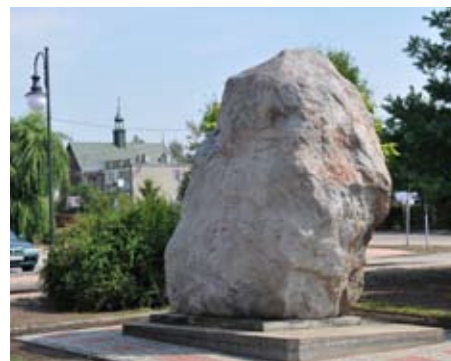
sporządził: inspektor H. Laska