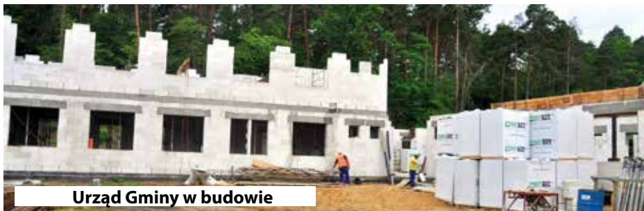
Urząd Gminy w budowie

Sporządził: Stefan Prusik, wójt Gminy