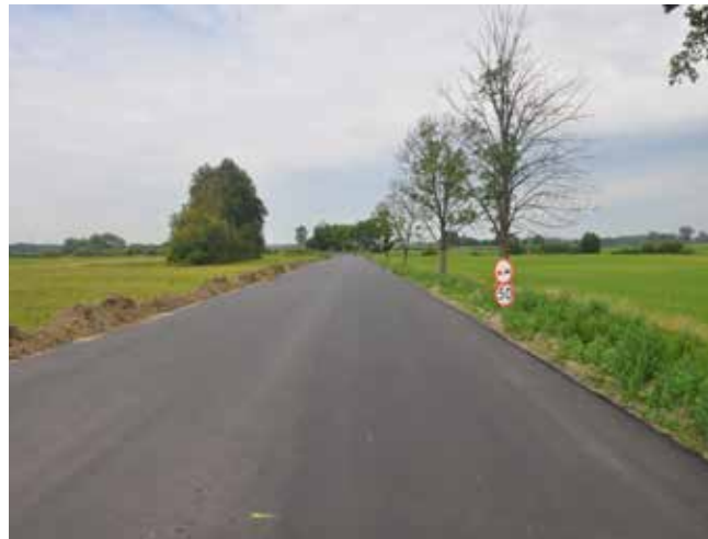
Nowa nawierzchnia drogi Durlasy – Obierwia, od strony rozjazdu na drodze krajowej nr 53