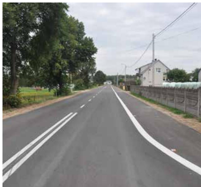
Stan obecny drogi Nasiadki – Gibałka, jeszcze przed uroczystym otwarciem