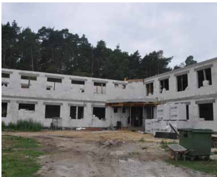
Budowa nowego Urzędu Gminy