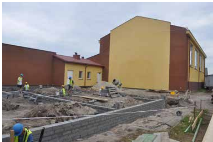
Finał budowy nowej hali sportowej przy Szkole Podstawowej w Białobeli